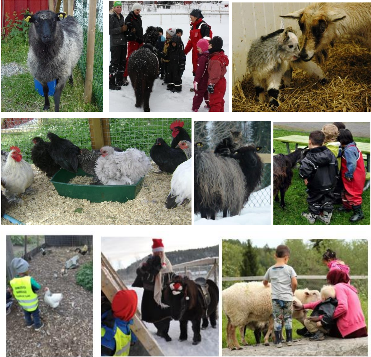
Bilder fra Maurtu barnebondegård etablert og drevet av Urtehagen. Aktiviteter med dyr – og med jule-feiring, der besøk av nissen med ponny inngår.