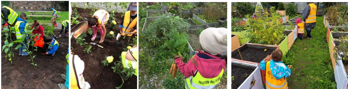
Gamlebyen barnehage har en lang tradisjon med å dyrke urter og grønnsaker med barna.

Dyrking av grønnsaker og urter er i dag en populær og utbredt virksomhet som bør føres videre i Middelalderparken. Det er sikkert flere som vil se dette som en spennende utfordring; å videreføre middelalders praksis og erfaringer på dette området til Oslo i dag. Vi tillater oss å peke på at barn i Gamlebyen barnehage har vært med å dyrke grønnsaker og urter i barnehagen i mange år, som på disse bilder: