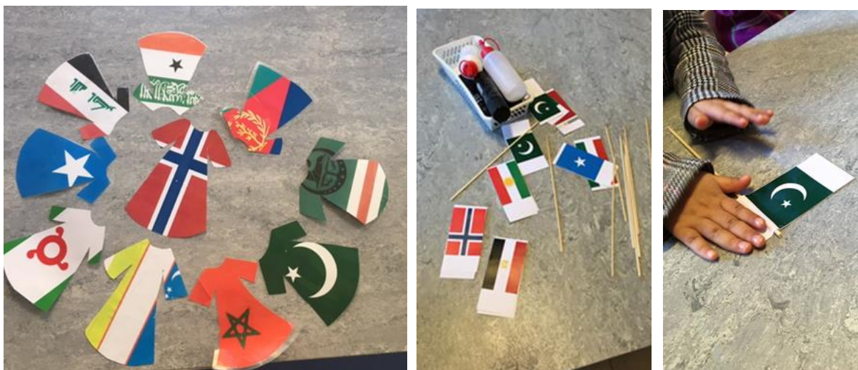
Mangfold i land og bakgrunn.

Bildene under viser eksempler på flerkulturelt arbeid i Gamlebyen barnehage: