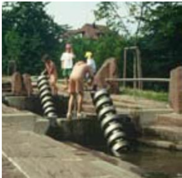
Middelalderparken for «allsidig bruk og aktivitet».

Det anføres i aktuelle planer: « Eksposering av middelalderminnene skal kombineres med tilrettelegging for bruk av parken som rekreasjonsområde ... » Og: « Det legges til rette for etablering av små og offentlige rom på gateplan som innbyr til allsidig bruk og aktivitet. » (Kilde: Bærekraft i Bjørvika som vedtatt av bystyret.) Vi tenker dette også skal gjelde for Middelalderparken.