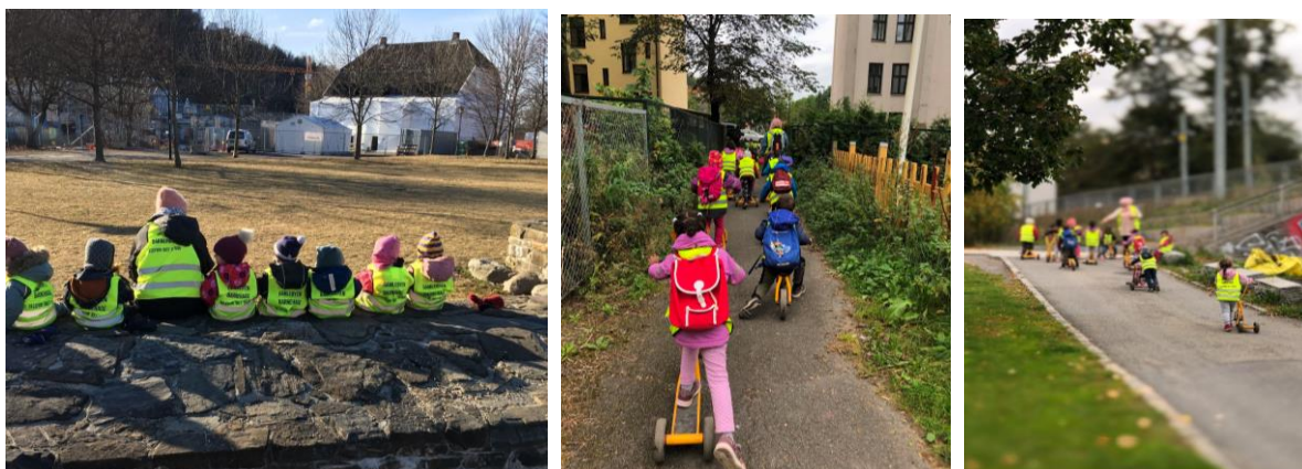
Bilder av barn fra Gamlebyen barnehage som er på tur i nærområdet.

Vi tillater oss noen innspill om Urtehagen/Gamlebyen barnehage med eventuell rolle i Middelalderparken, og følger det gjerne opp i en dialog om aktuelle planer for parken.